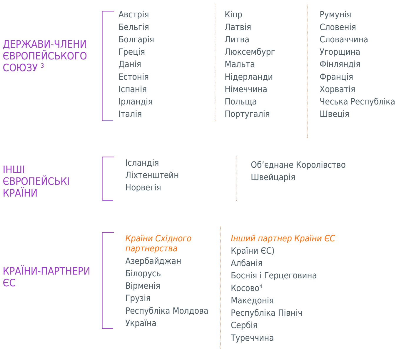
Діаграма 1. Прийнятна територія проекту Європейської школи Східного партнерства в Грузії

ДЛЯ БІЛОРУСІ: наразі бути законним постійним жителем Білорусі, перебувати в Білорусі або переїхати в одну з країн, зазначених у Таблиці 1, починаючи з серпня 2020 року.